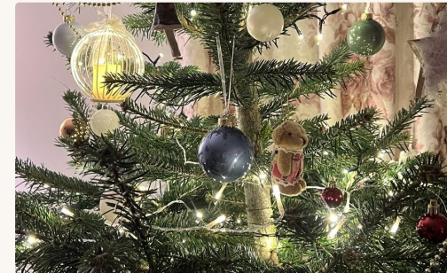
Brad de Crăciun împodobit cu drag

Originile iei se pierd în timp, fiind documentată încă din perioada dacică. De-a lungul secolelor, ia a fost martora evoluției meleagurilor românești. Ia a inspirat și artiști celebri precum Henri Matisse, care a pictat celebra «La blouse roumaine» (1940), dar și designerul Yves Saint Laurent în 1999. Astăzi, ia este recunoscută la nivel internațional ca simbol al identității românești.