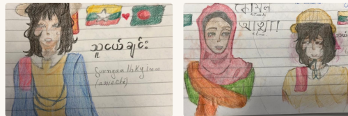
Ilustrațiile Almei Florescu