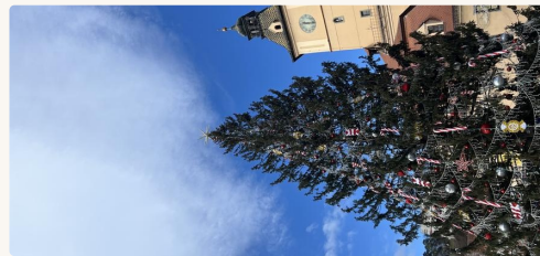
Brad de Crăciun — Brașov