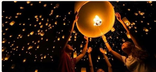
Lampioane în Myanmar

Și cred că aceasta este cea mai frumoasă lecție: încrederea și speranța că putem avea totul chiar și atunci când trăim cu puțin.