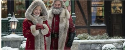
The Christmas Chronicles