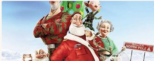
Arthur Christmas (2011)

Arthur descoperă că un copil nu a primit cadoul și pleacă într-o misiune nebună. Mesaj frumos: fiecare copil contează.